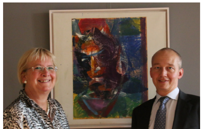
im Hintergrund „Kopf Moses ?“

Bei Interesse zum Erwerb unterschiedlicher Ernst Wille-Werke finden Sie weitere Informationen unter www.atelierwille.de .